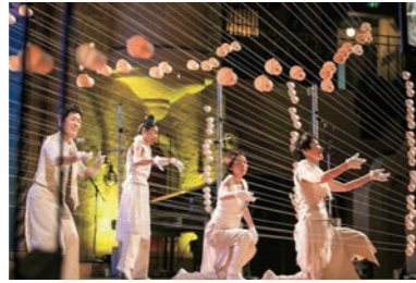
ストリングラフィ http://stringraphy.com