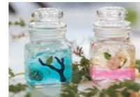
アロマジェルコロン