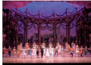
バレエ「くるみ割り人形」より

がホールに響き渡りました。演奏はもちろん山形交響楽団。カーテンコールで響き渡る拍手はとても暖かく、多くのお客さまと一緒にこの公演を迎えることができ、うれしく思っております。ご来場いただきまして、誠にありがとうございました。(公演担当/W)