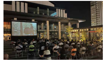
2022年 野外シネマイベント

山形国際ドキュメンタリー映画祭2023の期間中、経済産業省、山形国際ドキュメンタリー映画祭、やまぎん県民ホールが協力しあい、イベント広場に大きなスクリーンを設営して東北における芸術と地域の文化や魅力を考えるための野外上映を行います。上映と合わせて、東日本大震災以降、福島をはじめとする東北地域の復興やネットワーク構築に映画を通して関わる人々が、トークセッションに登壇します。