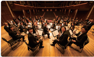
管弦楽：山形交響楽団 © Kazuhiko Suzuki