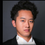
石上麻呂足 平欣史 Taira Yoshifumi