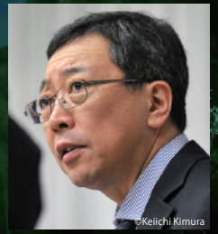
演出：中村敬一 Nakamura Keiichi, Director