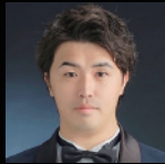
阿倍御主人 市川敏雅 Ichikawa Toshimasa