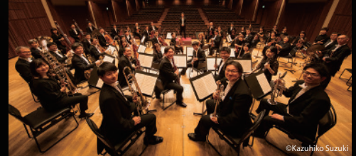
管弦楽：山形交響楽団 Yamagata Symphony Orchestra

合唱／びわ湖ホール声楽アンサンブル、歌劇『竹取物語』山形公演特別合唱団 山形公演合唱団指導／渡辺修身、深瀬 廉 山形公演合唱団ピアニスト／菅原美穂