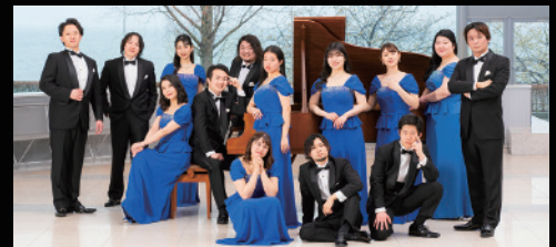
びわ湖ホール声楽アンサンブル BIWAKO HALL Vocal Ensemble