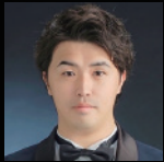
阿倍御主人 市川敏雅 Ichikawa Toshimasa