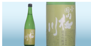
小国桜川 小国米美山錦純米吟醸 (飯川酒造株式会社)