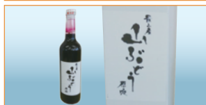
山ぶどうジュース