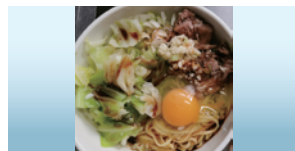
米沢牛の油そば (米沢牛の油そば普及委員会(こしや))