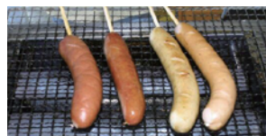
フランクフルト (農事組合法人 草間ハム加工組合)