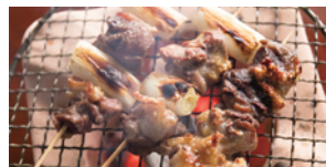
地鶏炭火焼 (合同会社おくに地鶏フーズ)