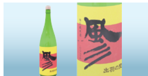
特別純米酒 風 彦 (若乃井酒造株式会社)