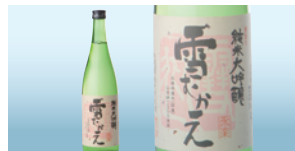
純米大吟醸 雪むかえ 永楽 720ml (樽平酒造株式会社)