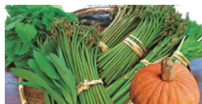
山菜・宇津沢かぼちゃ (なかつかわ農家民宿組合)