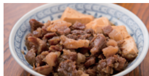
牛すじ煮込み (あつさり食堂)