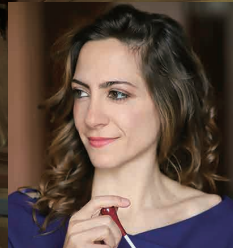
指揮：クレリア・カフィーエロ Conductor: Clélia Caferio