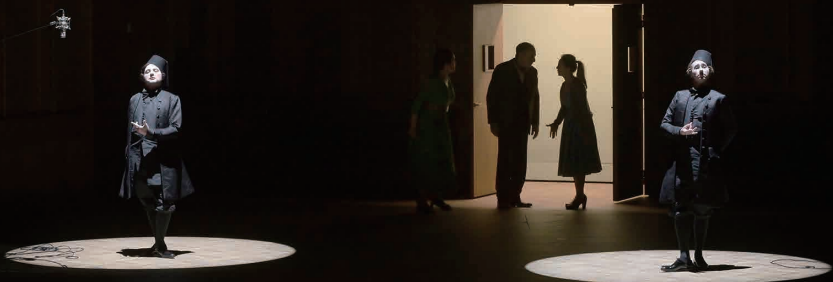
Yamagata Opera Festival Tokyo Nikiikai Opera