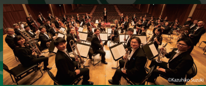
管弦楽: 山形交響楽団