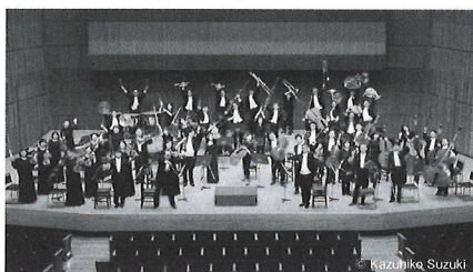
山形交響楽団 Yamagata Symphony Orchestra

指揮者(2013～2017)、東京佼成ウインドオーケストラ正指揮者(2014～2024)を歴任。このほか全国の主要オーケストラを指揮している。東京藝術大学音楽学部器楽科非常勤講師(吹奏楽)。尚美ミュージックカレッジ専門学校客員教授。