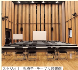
スタジオ1 ※椅子・テーブル設置例